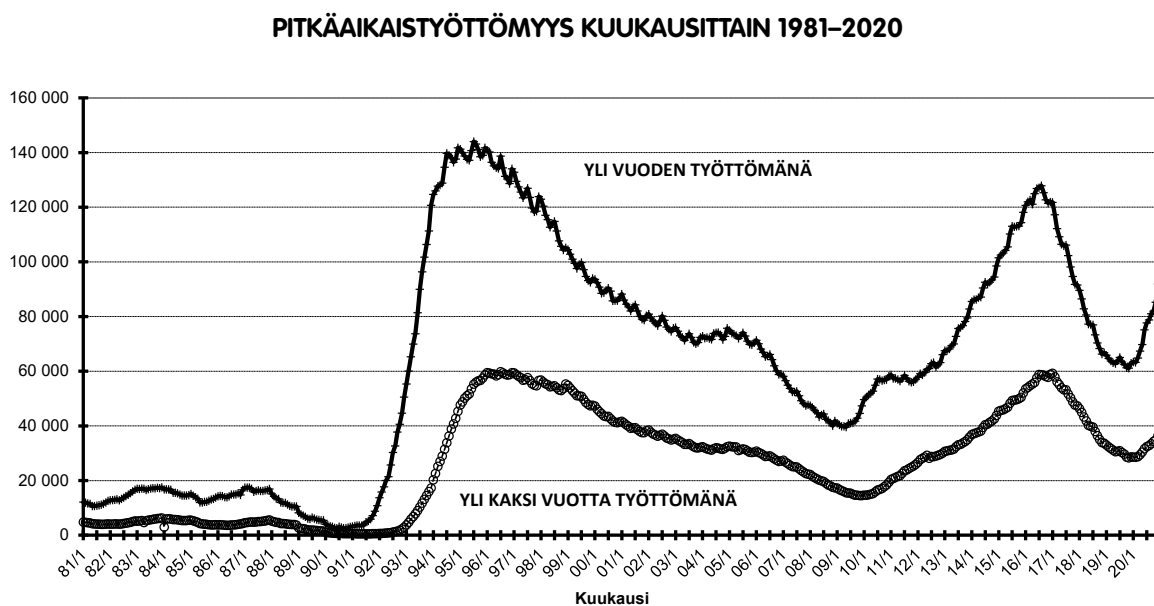
KUVA 6. Pitkäaikaistyöttömyys 1981–2020 työ- ja elinkeinoministeriön rekisteritietojen mukaisesti.

Jos pandemia ja siihen liittyvä talouskriisi pitkittyy, vaarana on, että pitkäaikaistyöttömyys lisääntyy aiheuttaen erilaista sosiaalista syrjäytymistä samaan tapaan kuin aikaisemmat talouskriisit viime vuosikymmeninä. Pitkäaikaistyöttömyys kääntyi jo kasvuun samaan aikaan kun pandemiaan liittyvät rajoitukset alkoivat keväällä 2020 (kuva 6).