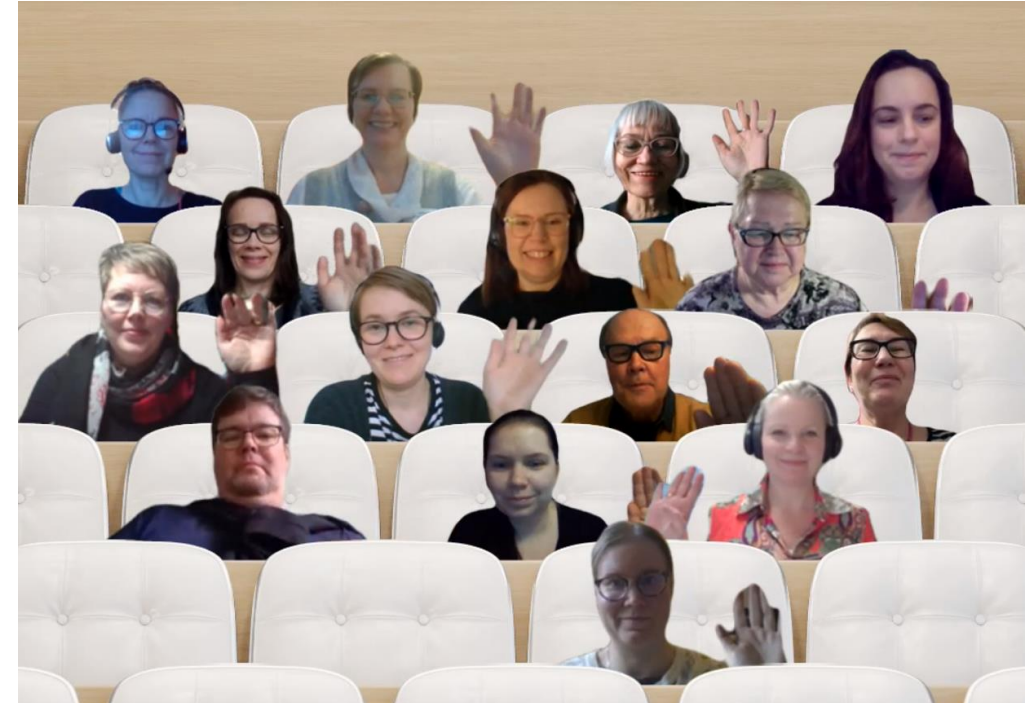
Valokuva 4. tapaamisesta 14.11.2021