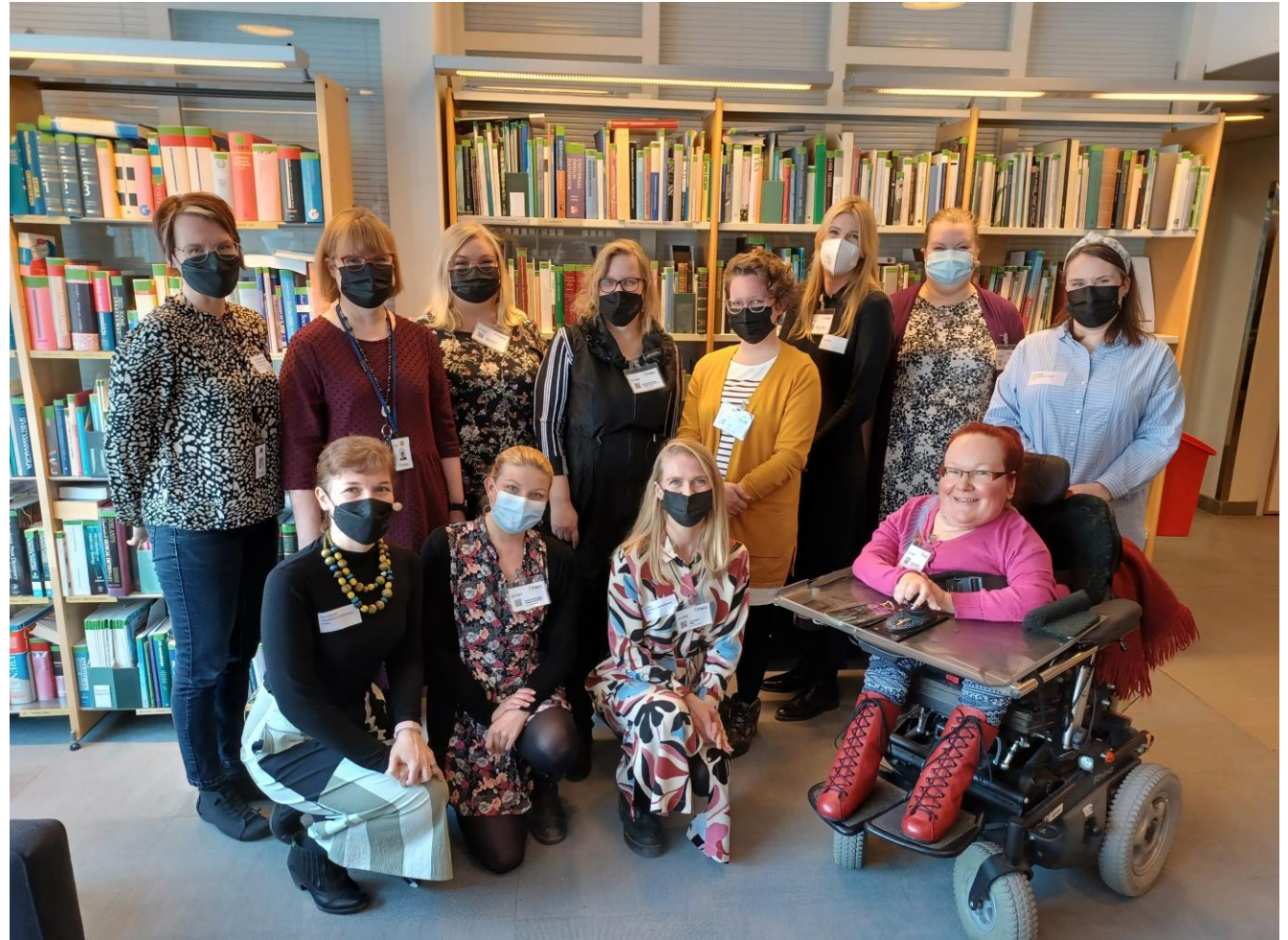
Valokuva 5. tapaamisesta 23.3.2022